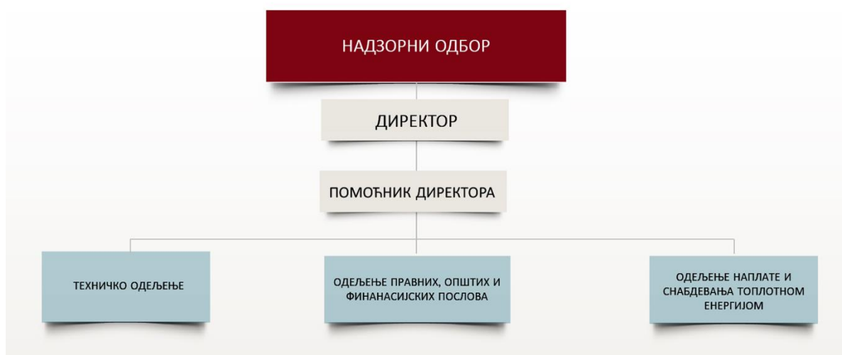
Слика – Организациона шема предузећа